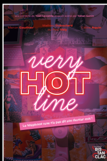
Very Hot Line