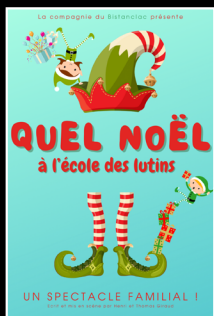
Quel Noël à l'école des lutins