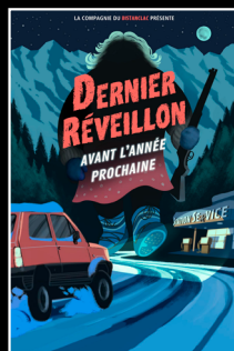
Dernier réveillon avant l'année prochaine