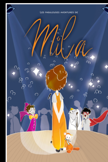
Mila, l'apprentie chanteuse