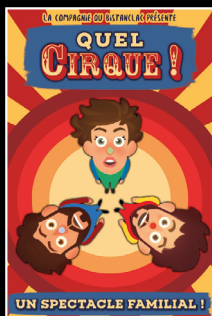
Quel Cirque !